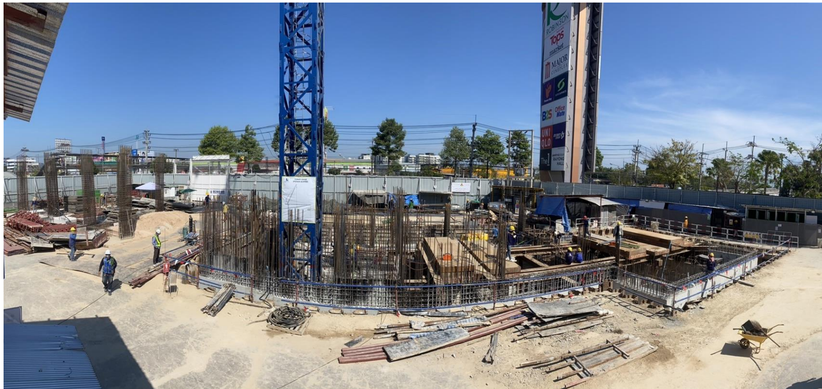
รูปที่ 1.3 สภาพโครงการในปัจจุบัน